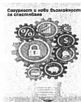
Сигурност и нови възможности за спестяване