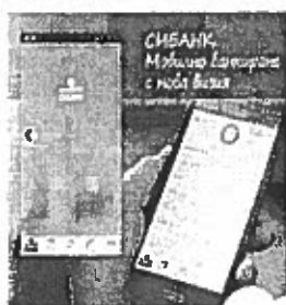
Модерно и удобно!