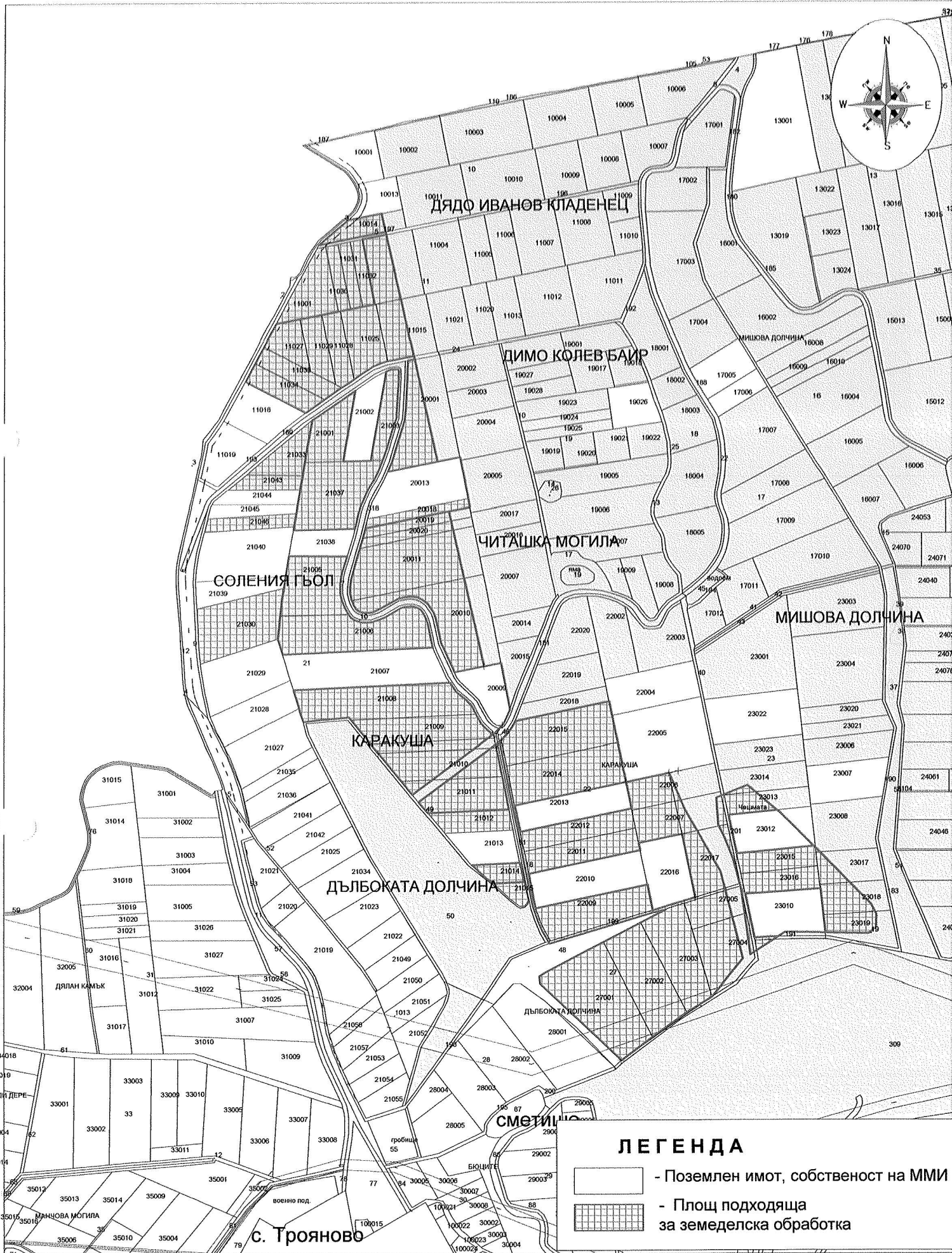
СХЕМА НА РАЗПОЛОЖЕНИЕ НА ЗЕМИ, ПРЕД ФРОНТА НА РУДНИК "ТРОЯНОВО-СЕВЕР" ПОДХОДЯЩИ ЗА ОТДАВАНЕ ПОД НАЕМ В ЗЕМЛИЩЕТО НА С. ТРОЯНОВО, ОБЩ. РАДНЕВО С ОБЩА ПЛОЩ 547.72 ДКА